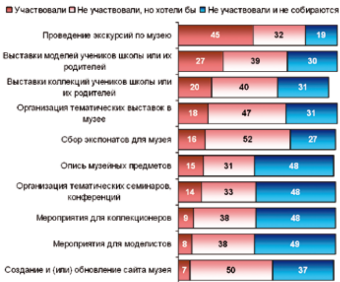
Рис. 4. Участие учеников в мероприятиях, проводимых в школьных музеях, %

ванием занимаются 14% из них. Коллекционирование распространено в еще большей мере, им увлечены 36% школьников. Соответственно создание выставок на основе коллекций учеников, моделей, собранных ими собственноручно или совместно с родителями, — перспективное направление музейной деятельности. У школьников присутствует явный интерес к мероприятиям подобного рода, кроме того, многие из них могут стать не только зрителями, но и непосредственными организаторами, участниками таких выставок, представляя свои коллекции или демонстрируя результаты своего труда — собранные модели. Такие выставки могут помочь учащимся: