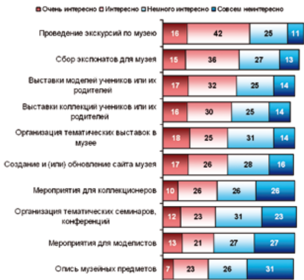
Рис. 3. Отношение учеников к мероприятиям, проводимым в школьных музеях, %