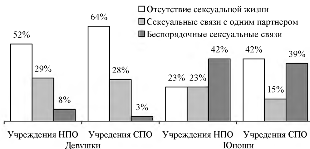
Рис. 3. Характер сексуальной жизни девушек и юношей различных учебных заведений

Формы рискованного сексуального поведения. О наличие опыта сексуальных отношений говорят более половины учащихся учреждений НПО и СПО. Многие из них практикуют беспорядочные сексуальные связи (30%). Несмотря на более юный возраст, учащиеся ПУ более осведомлены об этой стороне жизни, чем студенты техникумов, однако эта осведомленность не связана с парными сексуальными отношениями (рис. 3).