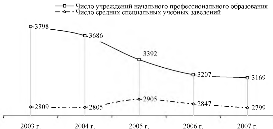
Рис. 1. Число учреждений начального и среднего профобразования 1

1,649 млн. учащихся человек, то к 2008 году число учащихся сократилось до 1,253 млн. человек. Отметим, что в 1990 году число учреждений НПО составляло 4328 и обучалось в них 1,867 млн. учащихся. Не все гладко в системе среднего специального образования. Несмотря на то, что до 2006 года наблюдался рост числа учреждений СПО, но последующие два года характеризуются уменьшением их числа и сокращением учащейся в них молодежи.